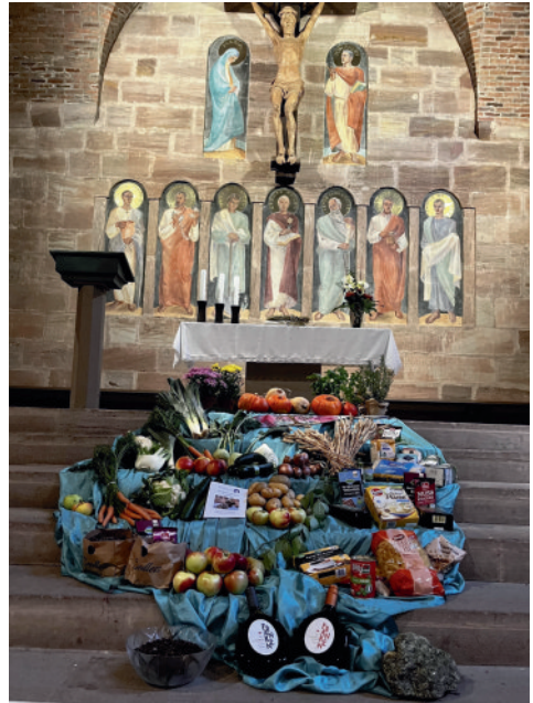
1 + 2 Erntedank, 3 Segensgottesdienst, 4 Kita St. Martin